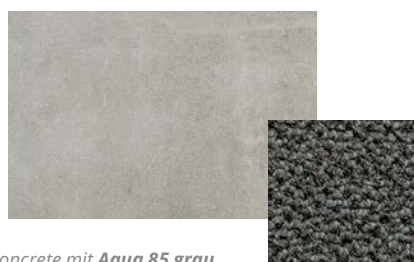
Concrete mit Aqua 85 grau

Aqua 85 ist die leistungsstärkste Matte, wenn es um Schmutzaufnahme geht, dank ihrer Twin Fibre Florkonstruktion. Eine Produktinnovation, bei der harte Kratzergarne und dünne feuchtigkeitsabsorbierende Garne nebeneinander getuftet werden, um eine optimale Schmutzaufnahme zu gewährleisten. Eine luxuriöse Matte mit warmer Ausstrahlung für stark beanspruchte Bereiche (Klasse 33) an Top-Standorten, die repräsentativ sein und bleiben sollen.