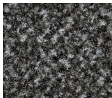
Grau 095 NCS: 8502B