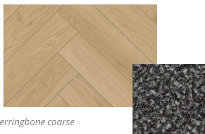
Wood light oak floor herringbone coarse mit Nubia Grau